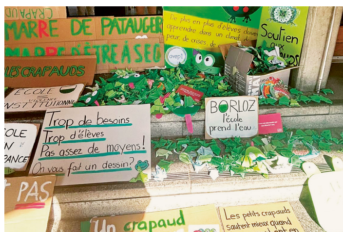
Installation provisoire des panneaux de la manifestation du 16 juin 2025 devant le DEF.

Concernant le préscolaire, l'AVEP1 et la SPV ont défendu une meilleure transmission des informations entre les différents intervenants et structures, par exemple le SEI (service éducatif itinérant), afin que celles-ci parviennent aux enseignant-es; la possibilité d'organiser des rencontres en amont lorsque les situations sont connues (réseaux entre parents et professionnels); des enclassements anticipés ainsi qu'un travail autour de la séance de pré-rentree afin de légitimer, aux yeux des parents, les apprentissages fondamentaux des deux premières années de la scolarité. Pour l'AVEP1 et la SPV, cette entrée à l'école doit susciter plus d'intérêt et d'importance et être considérée, au même titre que le demi-cycle 7-8P, comme une vraie transition vers la vie scolaire.