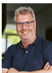
Par Yves Froidevaux Secrétaire général