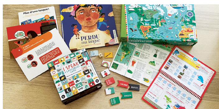
Cette mallette contient de nombreuses ressources interculturelles, des idées d'activités ludiques et des propositions interlinguistiques.

Le jeu I speak 6 languages 3 permet de découvrir une centaine de mots dans 6 langues différentes (français, anglais, allemand, italien, espagnol et catalan). Ce jeu permet également de manipuler les 6 langues tout en s'amusant. Il est possible d'inciter les élèves à établir des liens entre les langues dans une perspective d'approche interlinguistique. Pour l'AVESAC, ce qui est intéressant avec ce jeu c'est qu'il peut facilement être complété avec les autres langues présentes dans la classe. En effet, on peut y ajouter un dé, dessiner les drapeaux correspondants et enrichir le glossaire avec les langues ajoutées. C'est une façon peu