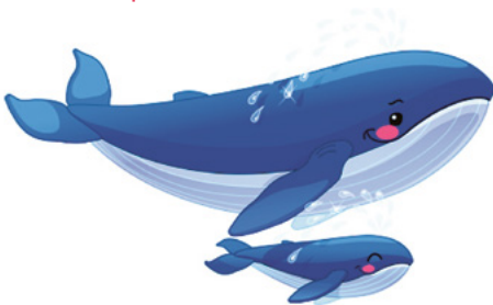
« La baleine bleue » de Steve Waring, une chanson adaptée aux cycles 1 et 2.