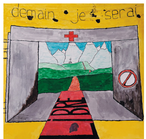
Dessin d'élève réalisé en arts visuels.