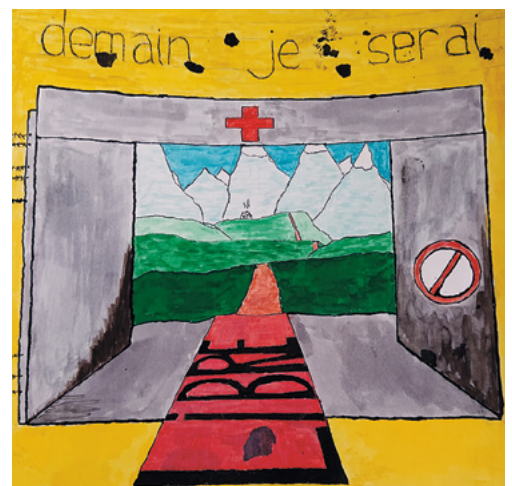
Dessin d'élève réalisé en arts visuels.