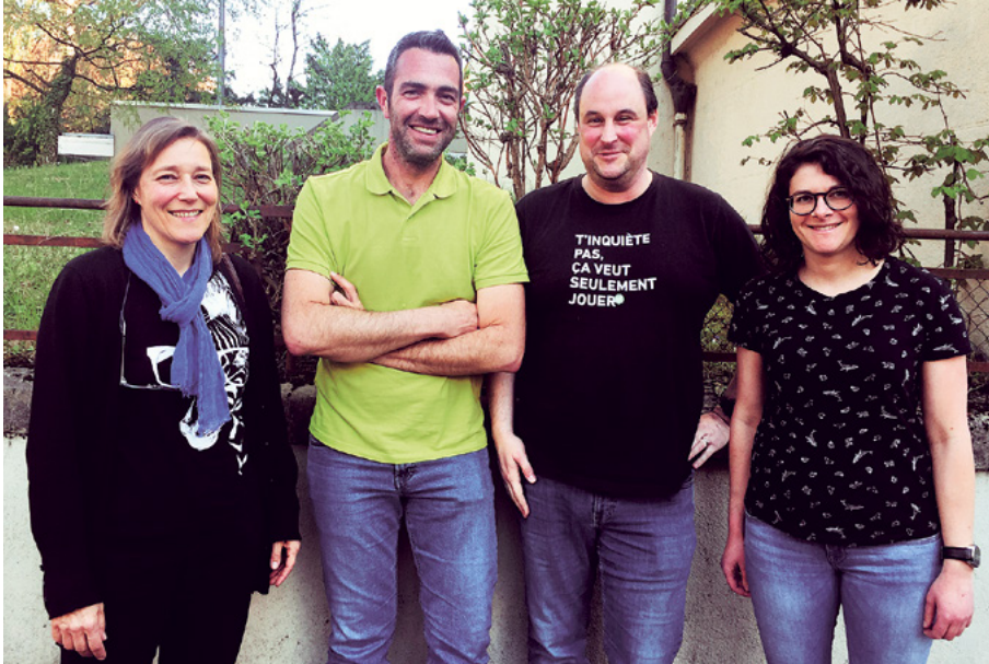
Le comité de l'Association vaudoise des enseignants du deuxième cycle primaire (AVEP2)

Les épreuves cantonales de référence (ECR) et l'orientation en 8H sont des thématiques qui accompagnent l'Association vaudoise des enseignants du deuxième cycle primaire (AVEP2) depuis ses débuts. Les témoignages des membres ont permis de mettre en lumière le facteur stress inhérent aux ECR et à l'orientation autant pour les enseignants, les élèves que leurs parents. La pression est forte et parfois telle qu'elle a des effets pervers au point de détourner les épreuves cantonales et l'orientation de leurs buts premiers.