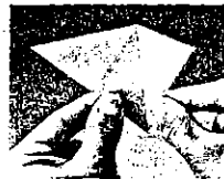
3. Redresser la partie droite de la feuille en équerre...