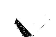
9. Voici le modèle VI.