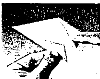
5. ... aplatir sur le corps de la figure.