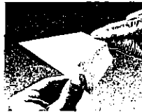
4. ... l'ouvrir et...