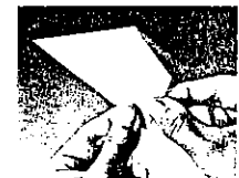
7. ... vers la droite.