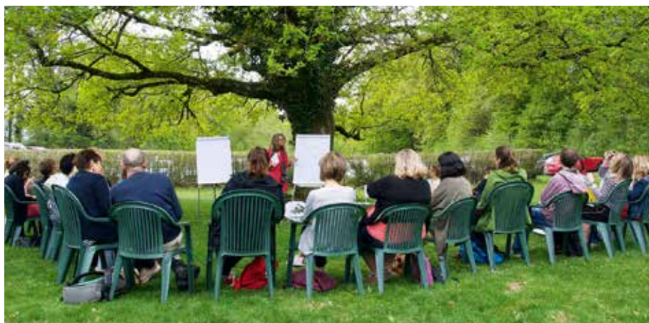
Les participants de l'atelier relatif à la communication non violente ont profité du cadre de Crêt-Bérard.

Mercredi 25 avril, Crêt-Bérard. Sur les hauts de Puidoux, grand soleil, arbres en fleurs et campagne verdoyante, 130 collègues participent au Forum pédagogique organisé par la SPV, alliant deux thèmes qui peuvent sembler paradoxaux: autorité et bienveillance.