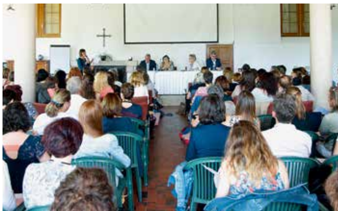
Plus de 140 collègues ont écouté la table ronde en fin de matinée.

Mme Dreifuss se positionne clairement: «Il n'y a pas assez de reconnaissance que certains enfants présentent des besoins particuliers, pas assez de reconnaissance également des besoins des enseignants qui les accompagnent.»